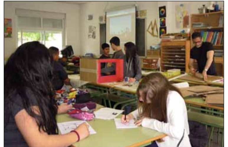
Alumnos del IES Vallecas I durante la construcción del teatrillo.

Con motivo del Día del Libro y conmemorando el IV centenario de la muerte de Miguel de Cervantes, el IES Vallecas I ha organizado un buen número de actividades para homenajear al libro como símbolo de cultura. Entre ellas destaca la elaboración de un teatrillo, dentro del taller de manualidades, siguiendo las directrices marcadas por la XVII edición de Vallecas Calle del Libro sobre una escena de 'El Quijote'. También han llevado a cabo una lectura pública de poemas y textos breves, así como una jornada de reparto gratuito de libros entre los viandantes frente a las puertas del centro educativo.