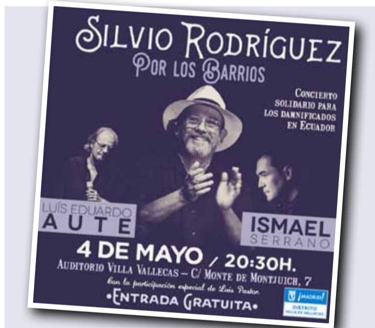
Cartel anunciador del 'megaconcierto' que se celebrará el 4 de mayo en Vallecas.