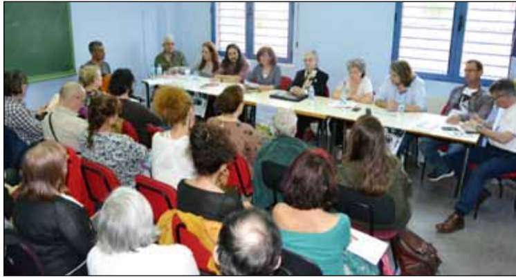
Los aficionados a la poesía llenaron el local del Grupo Tertulia PoeKas.